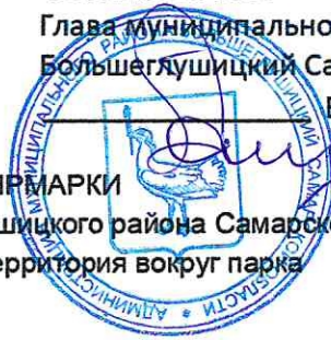
СХЕМА РАСПОЛОЖЕНИЯ ЯРМАРКИ на территории: с. Большая Глушица Большеглушицкого района Самарской области площадь Революции и прилегающая территория вокруг парка